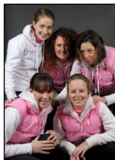
SwabO Ladies 2007

Na 3 jaar SwabO Ladies kunnen we terug kijken op een mooie periode waarin wij langzaam zijn gegroeid tot de organisatie zoals die er nu staat. De behaalde sportieve resultaten overtreffen elke verwachting zoals wij die hadden, toen wij in november 2007 startten met een klein clubje dames, maar wel vol met ambitie. De wens voor de komende seizoenen is dat wij verder kunnen bouwen aan een stabiele organisatie, waarin jonge rensters de kans krijgen om zich te ontwikkelen als renster en als mens.